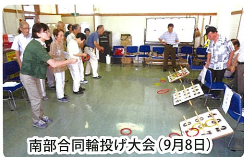
南部合同輪投げ大会(9月8日)