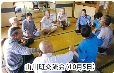
山川班交流会(10月5日)