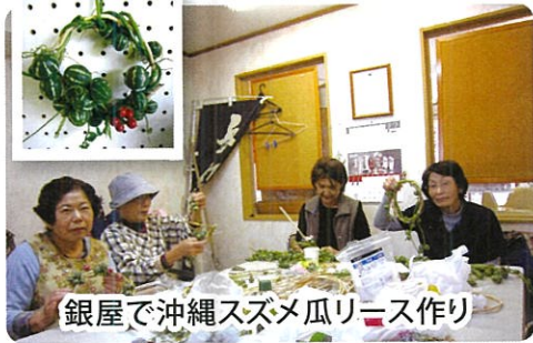
銀屋で沖縄スズメ瓜リース作り