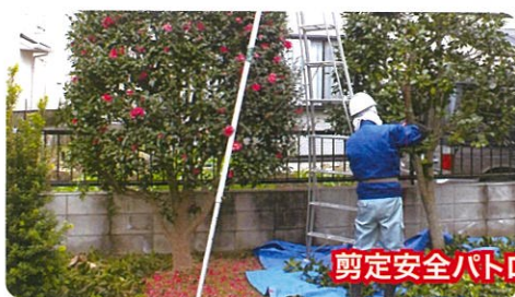
剪定安全パトロール(12/13)

皆さんと共に、昨年の事故発生を教訓に「心機一転」大幅に事故減少を図ることを目標に、安全活動に一層取り組んでまいります。