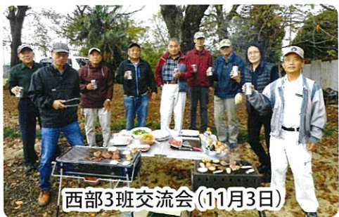
西部3班交流会(11月3日)