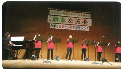
オカリナハーモニー歌音