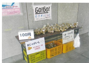
じゃがいも販売中

シルバーのホームページ、リニューアルしました。令和5年6月1日、当シルバーホームページが、リニューアルされました。事務局のこと、お仕事のこと、入会情報等、いろいろな情報がご覧いただけます。是非、ご覧になってお友達にも紹介してください。